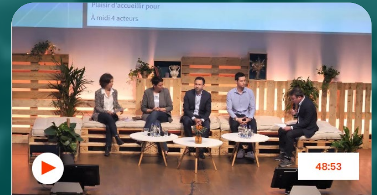
Table ronde - Transition énergétique : comment tendre vers la neutralité carbone ?