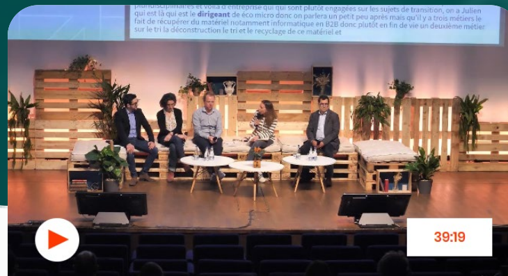
Table ronde - Économie circulaire : pourquoi ça ne tourne pas encore tout à fait rond ?