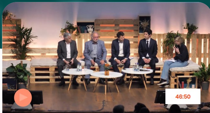
Table ronde - Contribution au territoire : comment les grands acteurs économiques régionaux peuvent renforcer l'économie locale ?