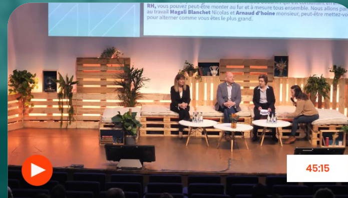
Table ronde - QVCT & Santé en Entreprise : Entre burn-out et babyfoot, comment maintenir une QVCT optimale ?