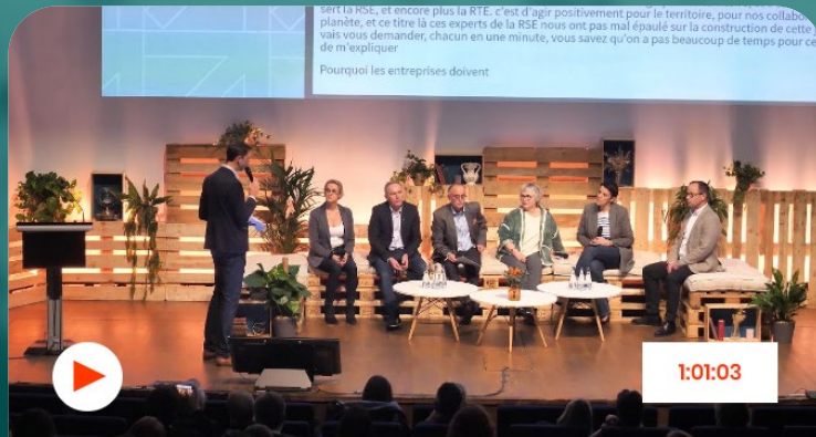
Plénière d'ouverture - Résolution 2024

11 AVRIL 2024 AU PALAIS DES CONGRÈS DE BORDEAUX