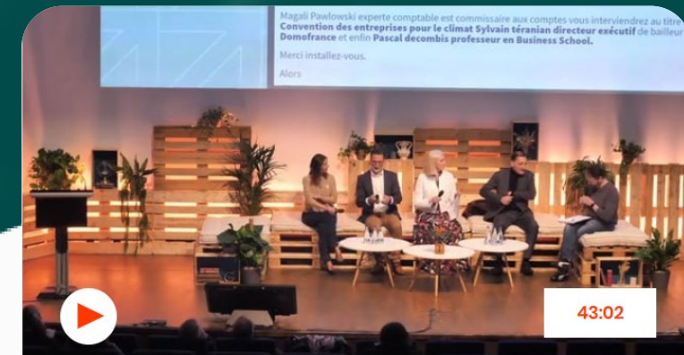
Table ronde - Finance durable et dynamique territoriale