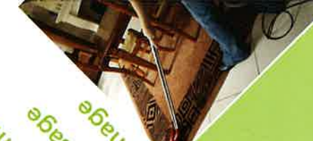
Aide à domicile Repassage Menage