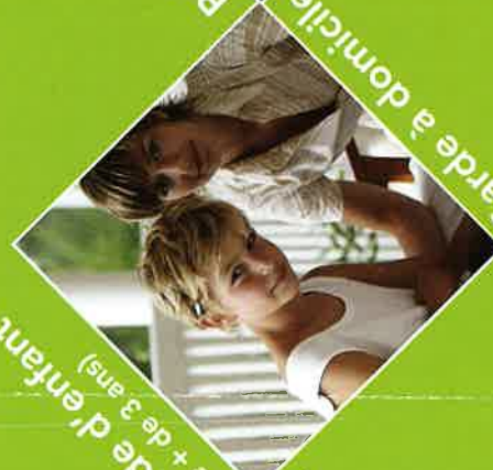
Garde d'enfant (de + de 3 ans)